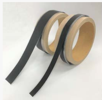
【テープタイプの製品例(開発品)】